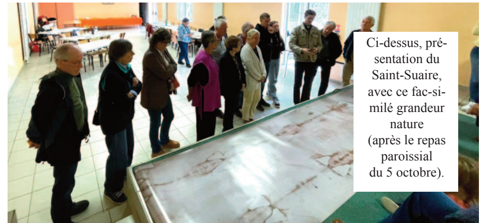
Ci-dessus, présentation du Saint-Suaire, avec ce fac-similé grandeur nature (après le repas paroissial du 5 octobre).

Le saint suaire arrive au même moment dans un petit village de Champagne, à Lirey. Le Chevalier Geoffroy de Charny demande à l'évêque de Troyes, l'autorisation de l'exposer publiquement. Il l'obtient en 1357 et pour la première fois, les fidèles pourront assister aux ostensions du linceul.